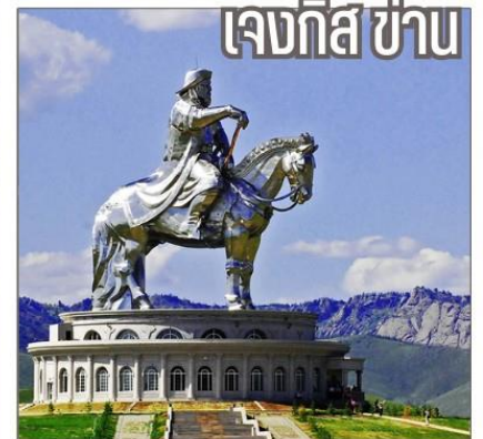
จักรพรรดิผู้ยิ่งใหญ่