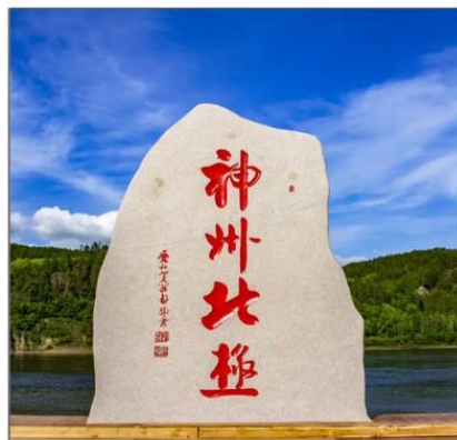
พื้นที่เหนือสุดประเทศจีน