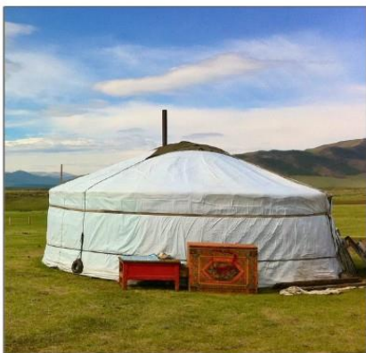
พักกระโจมมองโกเลีย